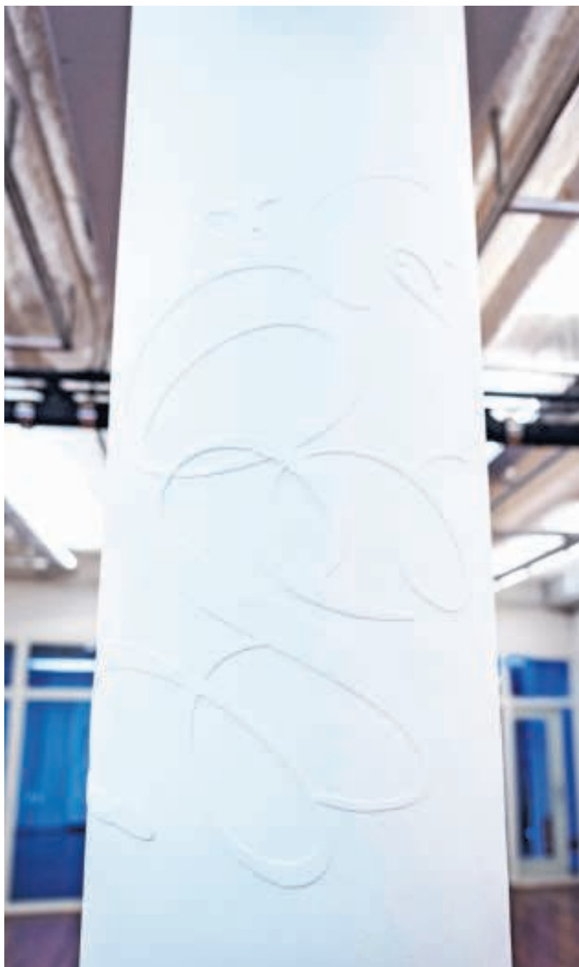
→ Werk van Josse Pyl in De Brakke Grond.

Voor je het weet loopt een serieuze poging tot lezen zomaar uit op dansen